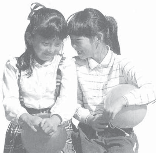
「日本の未来をになう子供たち」より (財)日本学校保健会刊

子どもはこの募金活動のもう一つの目的として、本会の事業活動について広く認識をいただくよい機会として考えております。したがってこの会の活動に一層のご理解をいただくとともに、関係者の皆様方から一口でも二口でも、善意のご協力をいただきたく存じておりますので何分よろしくお願い申し上げます。