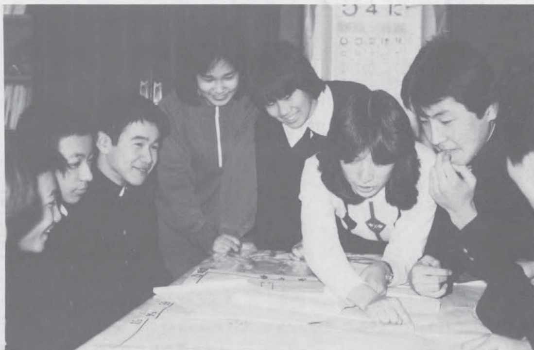
子どもと教師のふれあいから生れる保健指導

なお、本号からは、保健活動にすぐ役立つ、図表、統計などの資料を載せ、関係者が利用できる会報にしたいとつとめました。