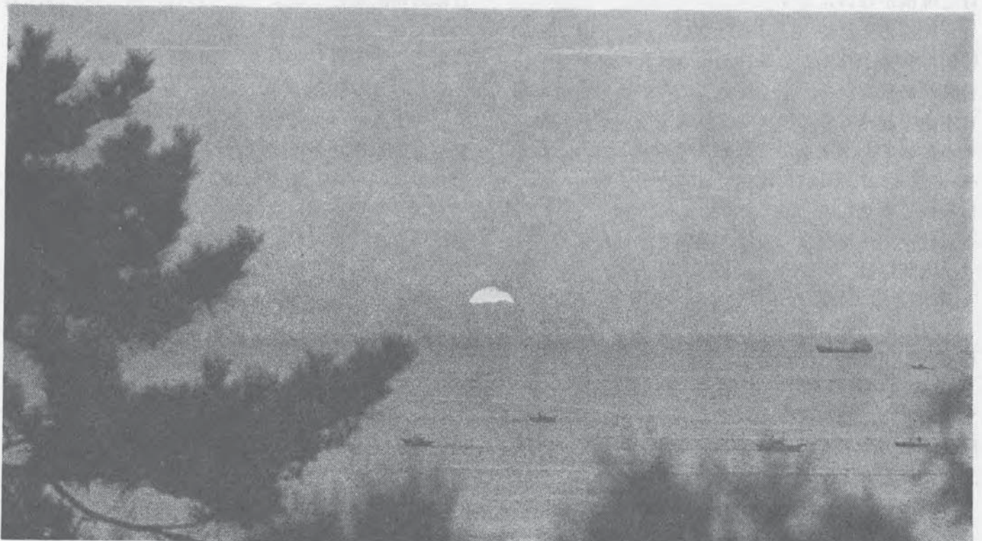
桂浜の日の出 (学業 尾崎 清氏)

年頭にあたり, いささか所感をのべ, 学校保健に関心を持って下さる皆様方の御健康と御発展を祈り御挨拶いたします。