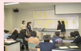
助成団体による高校でのHIV予防授業の様子

エイズ予防財団 TEL：03-5259-1811 FAX：03-5259-1812 担当：矢永