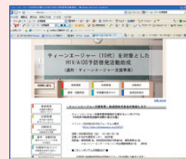
当ホームページのトップページ